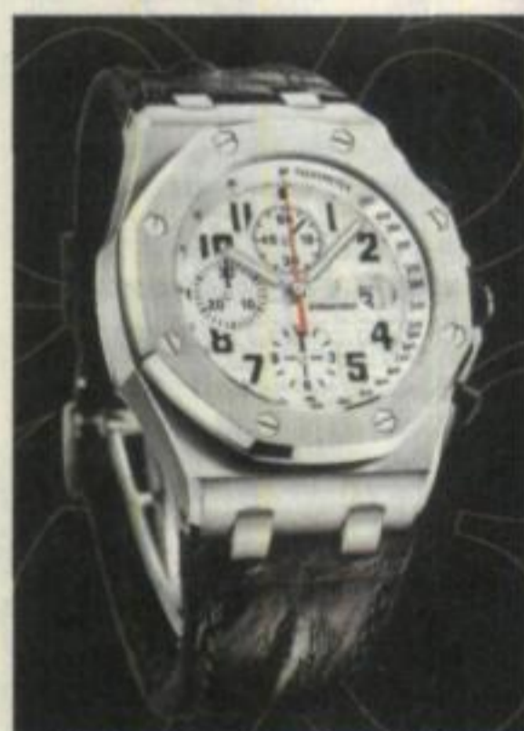
CONMEMORATIVO. El reloj Pride of México rinde homenaje al Bicentenario