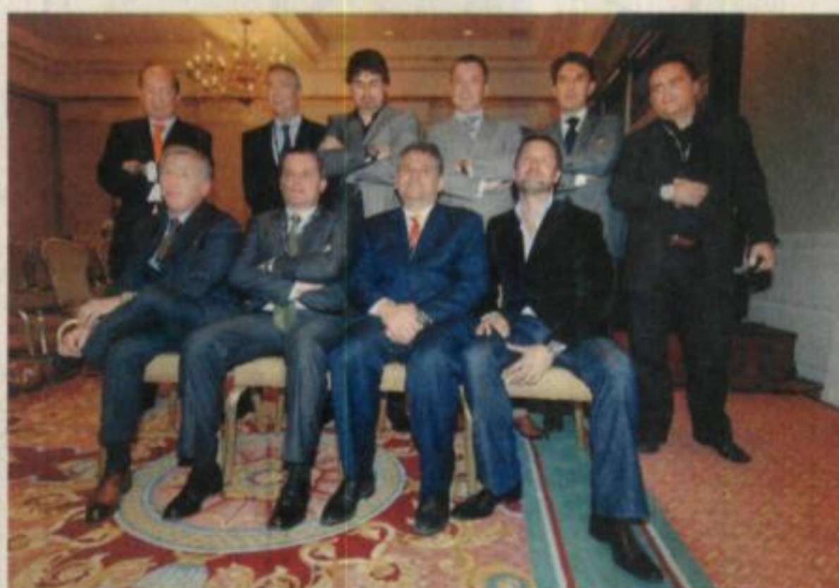
VISIONARIOS. Los empresarios aportaron ideas para afrontar la coyuntura

La tradicional y muy prestigiada firma respondió al reto de la alta relojería con gran éxito. Saberse rey de los joyeros y