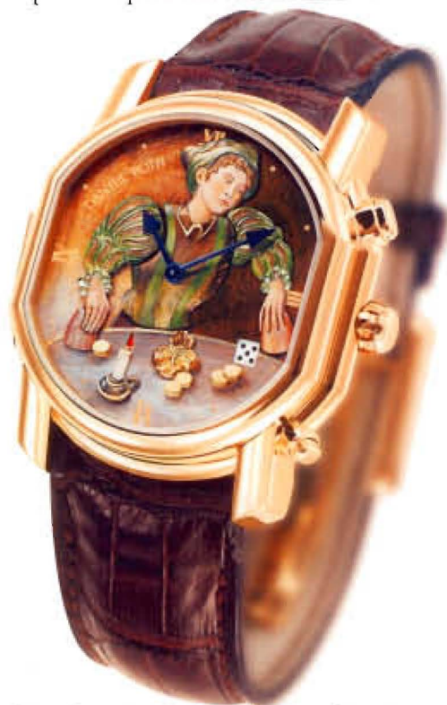
Avec Il Giocatore Veneziano, l'amateur de jeux de hasard a une chance sur 504 de prédire la bonne combinaison du lanceur de dés.

Car sur ce garde-temps hors du commun, le spectacle est ailleurs. A la demande ou de concert avec le mouvement répétition minutes sonnant les heures, les quarts et les minutes, un personnage automate peint à la main s'anime à la lueur d'une chandelle qui vacille. Durant huit secondes environ, le petit joueur vénitien inspiré du Caravage lance les dés et vous interroge sur le résultat. Il suffit à la fin de le lui demander, à l'aide d'un poussoir, pour qu'il lève les bras et découvre les dés. Pas moins de 504 combinaisons rendent l'issue difficile à deviner. Un régal pour les amateurs de hasard, qui ne seront que 42 dans le monde à pouvoir acquérir cette série ultralimitée. →