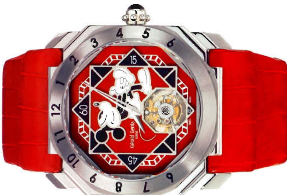
L'Octo Ultimate Fantasy réunit deux mythes, Mickey et le tourbillon. Edition limitée à 25 exemplaires.

très élaborée, cette montre est équipée d'un mouvement placé à l'envers, de manière à avoir la masse oscillante dessus. Un système ingénieux de roulements à billes en céramique se charge de transmettre l'énergie du fond jusqu'aux deux cônes tronqués, qui indiquent respectivement les heures et les minutes. La date est indiquée sur un grand cercle tournant autour du rotor en forme d'astéroïde, arme fétiche de Goldorak. Une forme que l'on retrouve également dans l'indication jour/nuit visible sur le sommet du cône des heures.