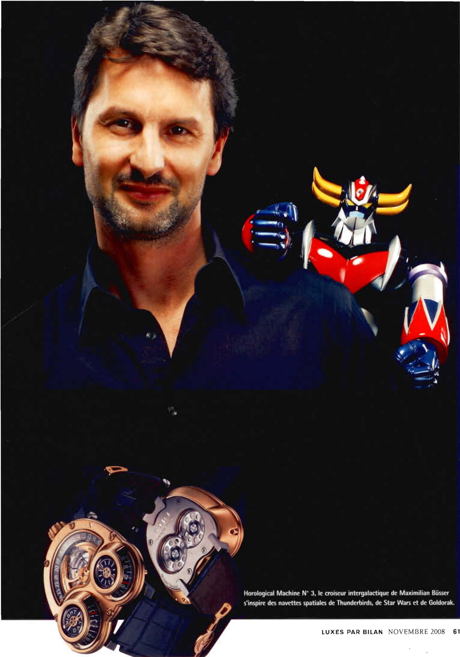
Horological Machine N° 3, le croiseur intergalactique de Maximilian Büsler s'inspire des navettes spatiales de Thunderbirds, de Star Wars et de Goldorak.