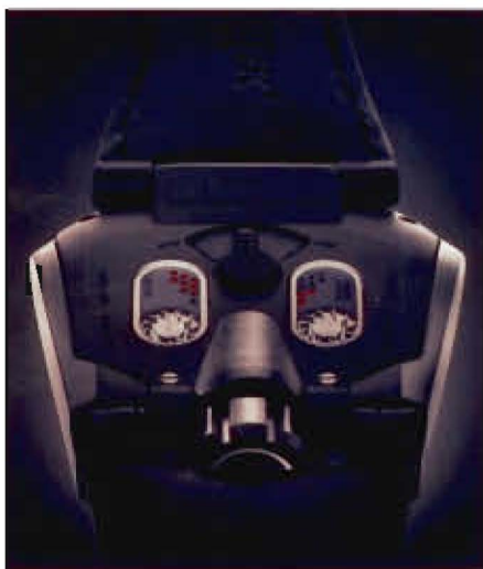
UR-202 Turbine Automatic, un boîtier très SF.

En chacun de nous sommeille un enfant, dit le dicton populaire. Et chez une poignée d'horlogers, il ne s'est carrément jamais endormi! Vaisseaux spatiaux, dessins animés ou jeux d'enfants: leurs sources d'inspiration renvoient l'acheteur au même qu'il était, pour son plus grand plaisir. A l'approche de Noël, Luxes par Bilan est allé faire son shopping au rayon jouets de la très haute horlogerie. Un rayon qui connaît un succès grandissant, même si les prix de ces babioles varient entre 74 000 et 630 000 francs.