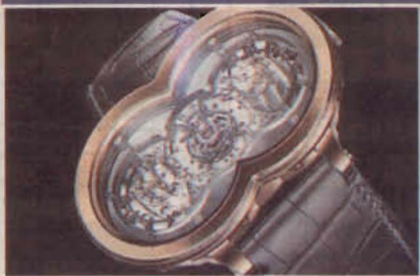
Часовникова машина 1 на MB&F може да се поръча срещу 1 200 000 лв.