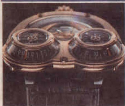
Космическата машина на швейцарската фирма също е сред най-скъпите часовници в света.