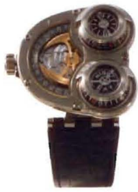
Sidewinder in white gold & titanium (25 pieces)