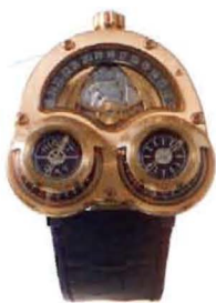
Starcruiser in pink gold & titanium (25 pieces)