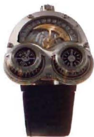
Starcruiser in white gold & titanium (25 pieces)