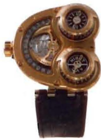
Sidewinder in pink gold & titanium (25 pieces)