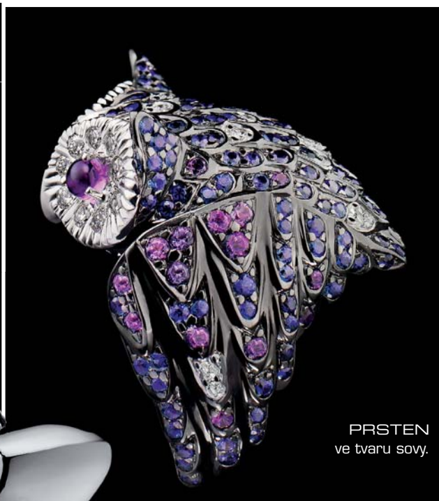
PRSTEN ve tvaru sovy.

Spojení tak unikátního výrobce hodinek, jako je M&F , který nedávno uvedl teprve čtvrtou řadu, a značky Boucheron, jejíž šperky nosí králové a na scéně je už 152 let, se zdá nepochopitelné. Do okamžiku, než se podíváte na JwelryMachine . Nebývalou klenotnickou verzí Horological Machine No3.