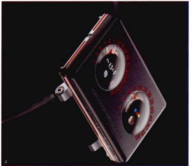
1.HM1 2.HM2 3.HM2-SV 4.HM2.2 Black Box

表，从来都不是大路货，绝对称得上「古怪」。由2007年推出的第一只表款Horological Machine No1 (HM1)，到今年的Horological Machine No4 (HM4)，没有一枚腕表谈得上「正常」。每次有新品发布，他都喜孜孜地转述别人对它们的评价，例如有人说HM2像电磁炉，有人说HM3像飞船……他都像小孩子受赞赏一样兴奋，然后它干脆替HM3造一个「青蛙版本」，让人知道，它也其实很像青蛙。甚至，他从自己童年时迷恋的Meccano玩具抽取灵感，